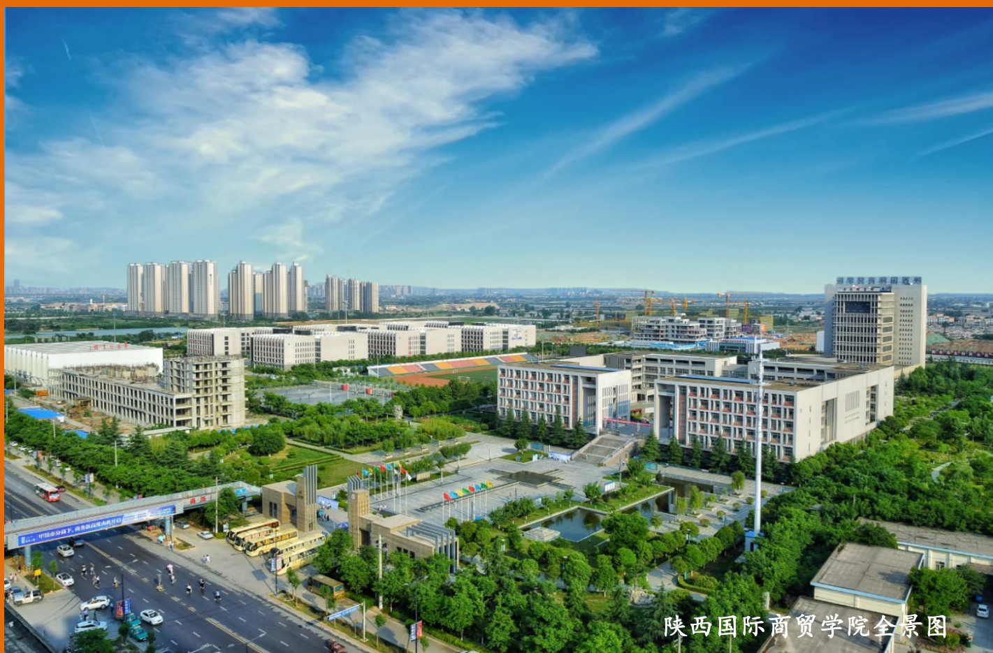
陕西国际商贸学院全景图